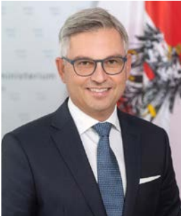
Finanzminister Magnus Brunner