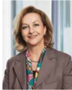
Dr. Maria Fekter Finanzministerin

Mit der Schaffung der Finanzpolizei haben wir einen wichtigen Schritt in diese Richtung gesetzt. Denn Betrugsbekämpfung bedeutet mehr Gerechtigkeit, mehr Chancengleichheit und mehr Schutz für die Wirtschaft und die Menschen in unserem Land.