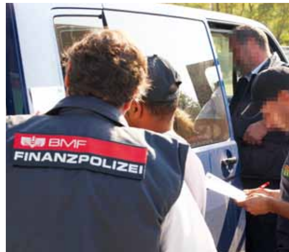
Mit Kontrollen nach dem Ausländerbeschäftigungsgesetz sorgt die Finanzpolizei für Fairness am Arbeitsmarkt.