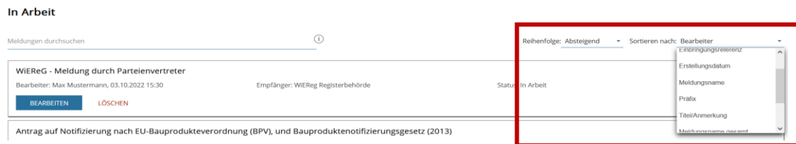
Abbildung 3: Sortierfunktion in der Meldungsablage

Neu hinzugekommen in dieser Sortierfunktion ist die Möglichkeit, die Meldungen in der Ablage nach Bearbeiter sortieren zu lassen.